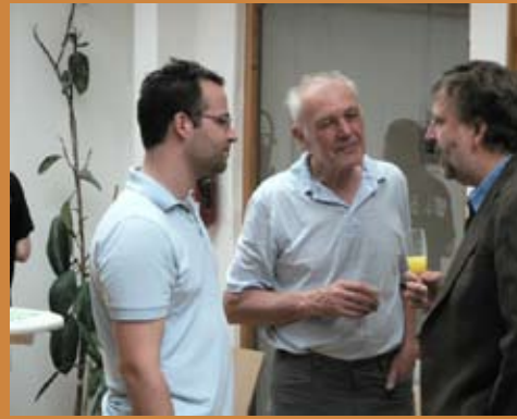
Впечатления и отзывы о праздновании 10-летнего юбилея межкультурного обмена в мае 2008 года