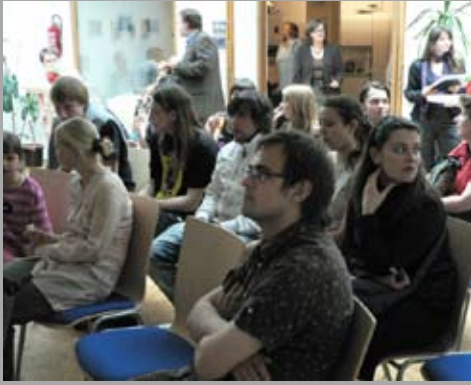
Eindrücke der 10 - Jahresfeier Mai 2008